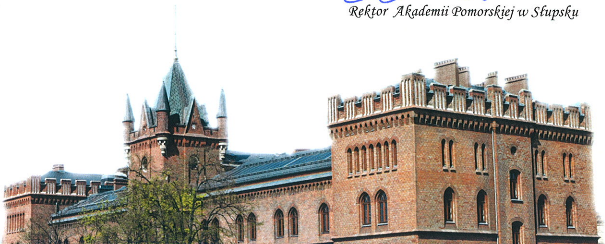
Rektor Akademii Pomorskiej w Słupsku